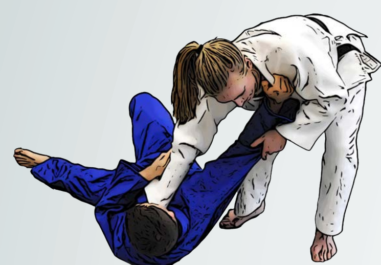
Übergang vom Werfen zum Halten