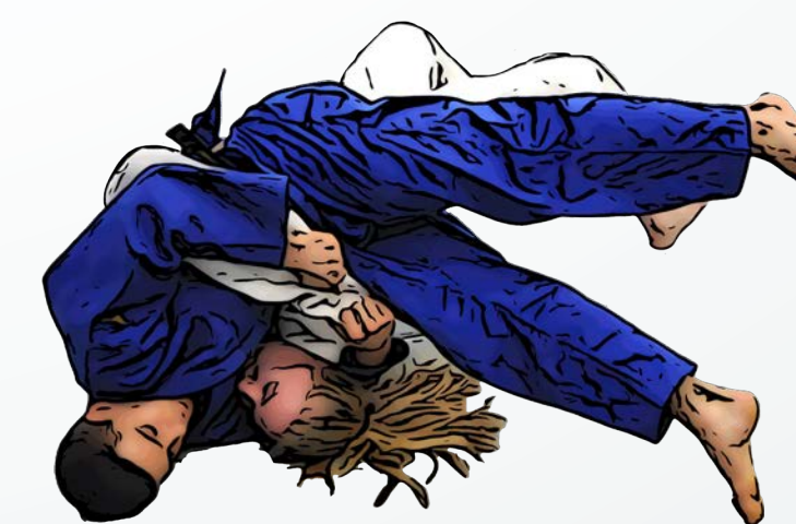
durch Brücke befreien