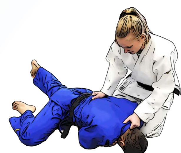
Umdrehen gegen Bauchlage