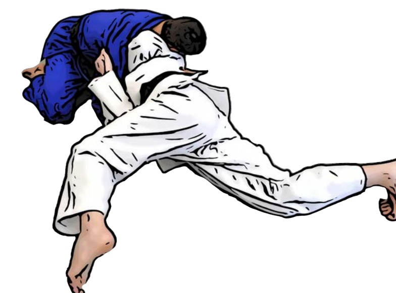
sich auf den Bauch drehen