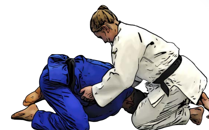
Angriff gegen die Bank