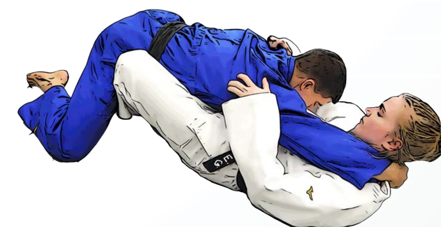
zwischen die Beine nehmen